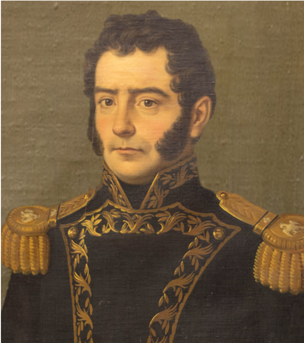
Don Melchor Muzquiz, Primer Gobernador del Estado de México

OBRA CONMEMORATIVA DEL BICENTENARIO DEL ESTADO DE MÉXICO Cuadrágésimo Cuarto Aniversario de la Presea “Estado de México”