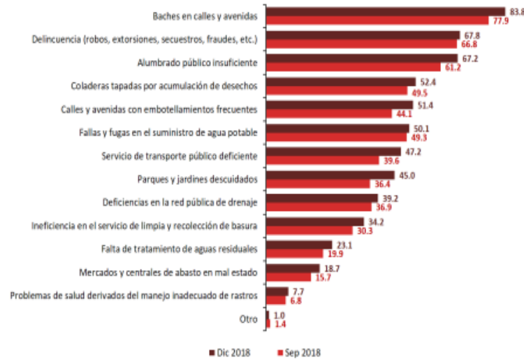
PROBLEMÁTICAS MÁS IMPORTANTES EN CIUDADES SEPTIEMBRE DE 2018 Y DICIEMBRE DE 2018 (Porcentaje)

Nota: a) Los porcentajes refieren a la población de 18 años y más residente en las ciudades de interés, según los problemas que consideran más importantes en su ciudad. Excluye la opción de respuesta "No sabe o no responde". b) A partir de diciembre de 2018, la encuesta es representativa para los municipios (únicamente zona urbana) del Estado de México: Neucaipán de Juárez y Tlalnequilar de Baz.