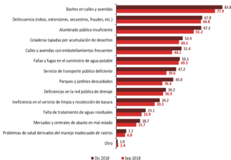
PROBLEMÁTICAS MÁS IMPORTANTES EN CIUDADES SEPTIEMBRE DE 2018 Y DICIEMBRE DE 2018 (Porcentaje)

Nota: a) Los porcentajes refieren a la población de 18 años y más residentes en las ciudades de interés, según los problemas que consideran más importantes en su ciudad. Excluye la opción de respuesta “No sabe o no responde”. b) A partir de diciembre de 2018, la encuesta es representativa para los municipios (únicamente zona urbana) del Estado de México: Naucalpan de Juárez y Tlalnepantla de Baz.